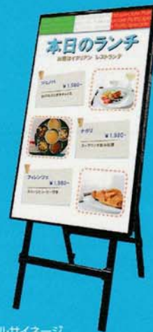
デジタルサイネージ

アイプロモクラブのご質問・お問い合わせはお気軽に。【裏面のFAX送信用紙もご利用ください。】