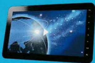
タブレット、パソコン